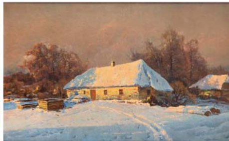
Wiktor Korecki „Pejzaż zimowy z chatą” olej/płótno 76 x 126 cm

http://www.oleja.pl/galeria/2/2993_175-widzisz-dziwny-ostatek-18-pozostawka-2012-godz-19.0016/70_024.html