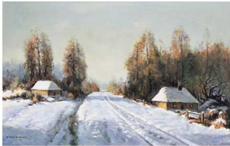
Wiktor Korecki "Pejzaż zimowy z chatami przy leśnej drodze", olej na płótnie, 61 x 91,2 cm