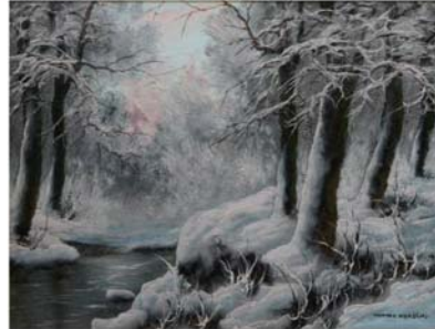
Wiktor Korecki "Pejzaż zimowy", olej na płótnie, 29 x 39 cm