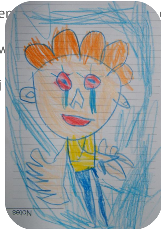
Emran Kassim, Autoportret autorstwa czteroletniego syna, Flickr , CC BY-SA.